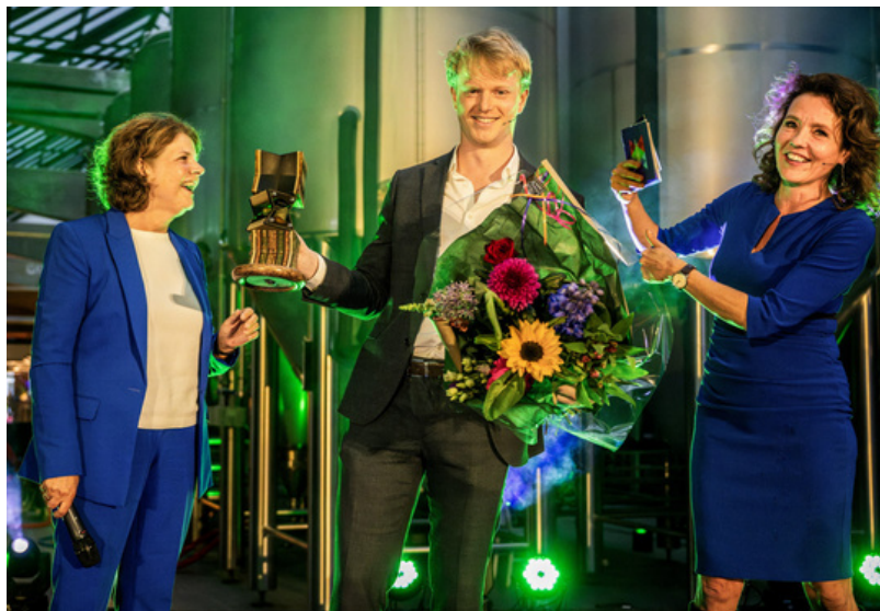
Zepp.Solutions winnaar Nieuwe Heldenprijs 2024

De Nieuwe Heldenprijs wordt uitgereikt aan de onderneming die volgens de jury het best scoort op diverse gebieden zoals innovatie, maatschappelijke relevantie en hun impact. Met deze prijs wil VNO-NCW regio Rotterdam ondernemerschap en innovatie stimuleren. De nadruk van de Nieuwe Helden prijs ligt niet op jarenlang geleverde prestaties, maar meer op innovatie en maatschappelijke impact. Hierdoor krijgen nieuwe, creatieve maatschappelijke initiatieven een kans en een podium. De prijs is onderdeel van de Rotterdamse Ondernemersprijs en wordt jaarlijks uitgereikt.