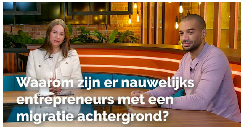
New Economy podcast van VNO-NCW regio Rotterdam - VNO-NCW West

In de komende twee jaar is het voornemen om hier invulling aan te geven.